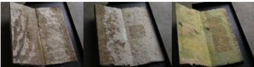
chaque page : 80 x 50 cm livre déployé : 450 x 80 cm